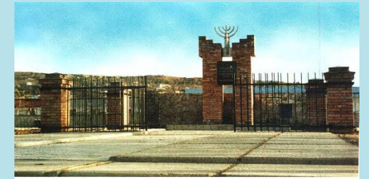
Открытие Мемориала жертвам и мученикам Рыбницкого гетто, 2004 г.